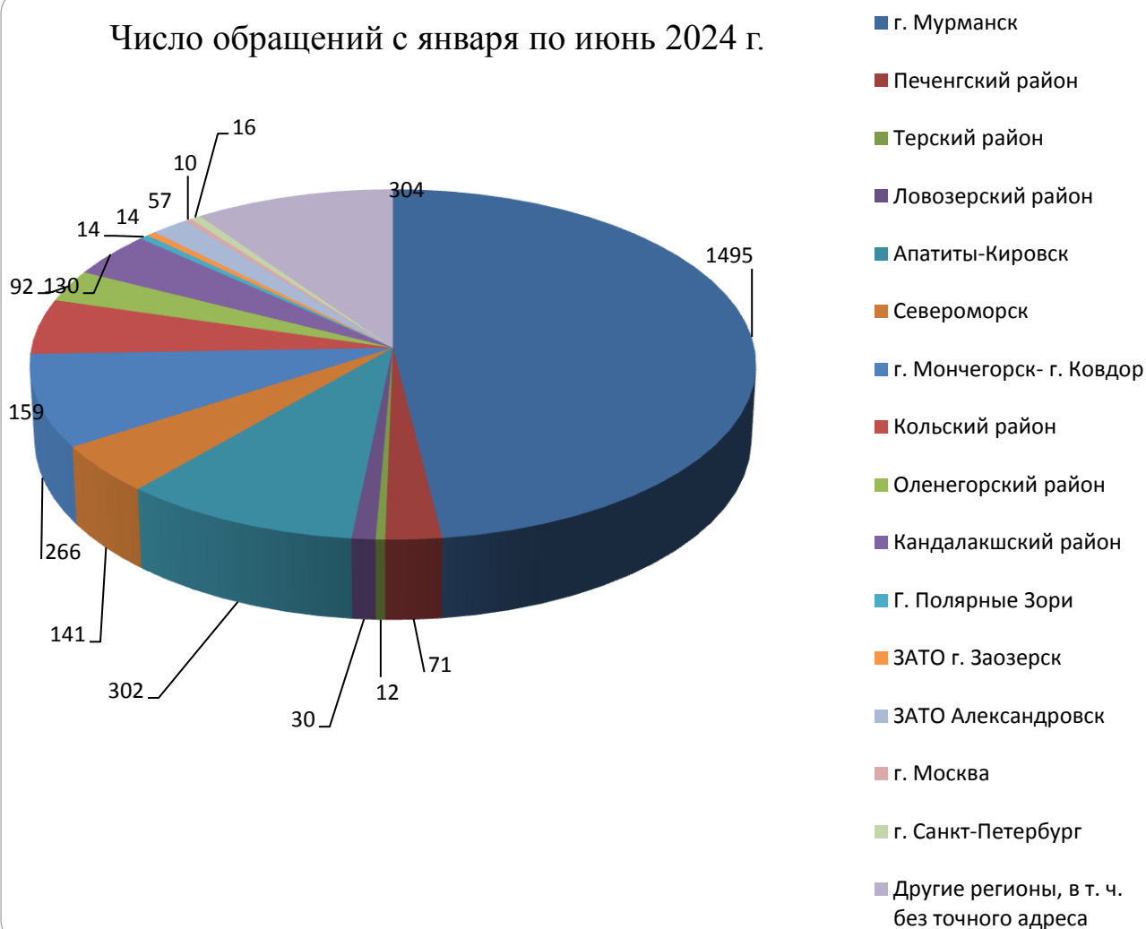
Число обращений с января по июнь 2024 г.

Конструктивные предложения граждан учитываются при подготовке законопроектов, принятии управленческих решений, определении путей улучшения организации оказания медицинской помощи населению Мурманской области и повышению ее эффективности.